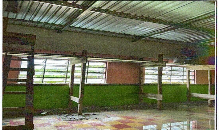
Foto 2: MODULO 2 INSTALACION CAMBIO DE TECHO Y REMOZAMIENTO DE PARED