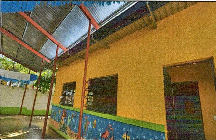
Foto 3: MODULO 2 MEJORAMIENTO INSTALACION CANALES CON BAJADA DE AGUA PLUVIAL